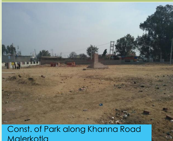
Const. of Park along Khanna Road Malerkotla