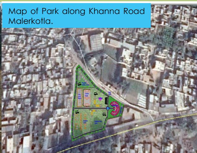
Map of Park along Khanna Road Malerkotla.