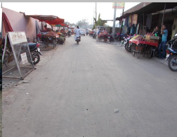
Construction of road in opposite baba Narsingh Dass Daramshala