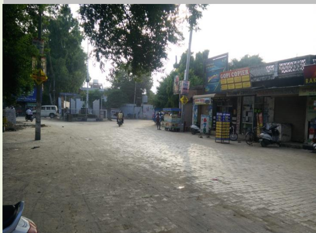
Laying Interlocking Tile in College Chowk